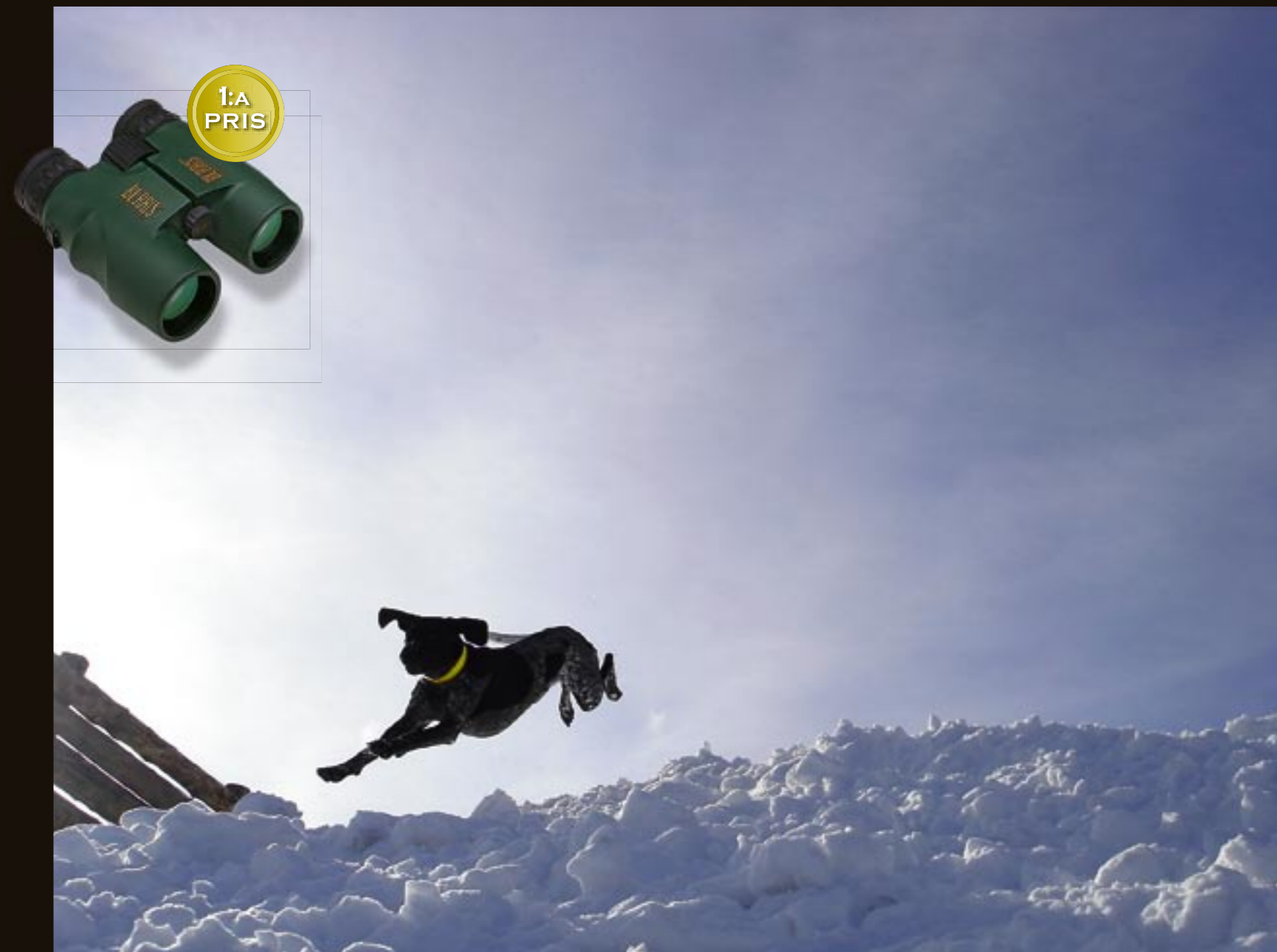
HUND. Eddie, korthårig vorsteh. Bilden är tagen på Långberget, Värmland.

OBS! Vi förbehåller oss rätten att redigera bilden om det behövs.