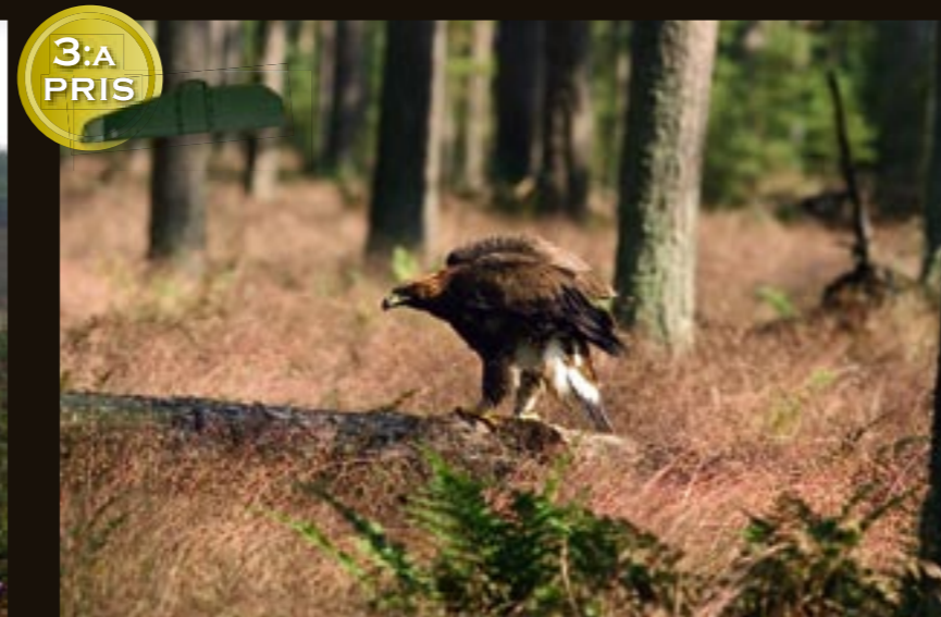
OBSERVATION VILT. Örn, Skåne.