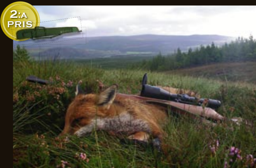
HIGHLAND FOX. Räv i Skottland, norr om Inverness.